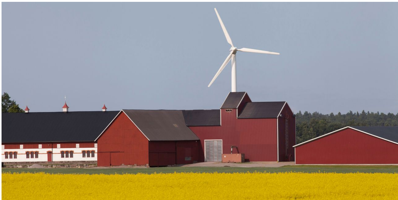
Framtidens melodi? Vindkraftverk i Närke.

Trots ett växande fokus på utveckling, hållbarhet och klimathot har den satsning på framtidsforskning som inleddes på 1960-talet nedprioriterats under lång tid. Nu vore tiden mogen för en renässans för långsiktigheten.